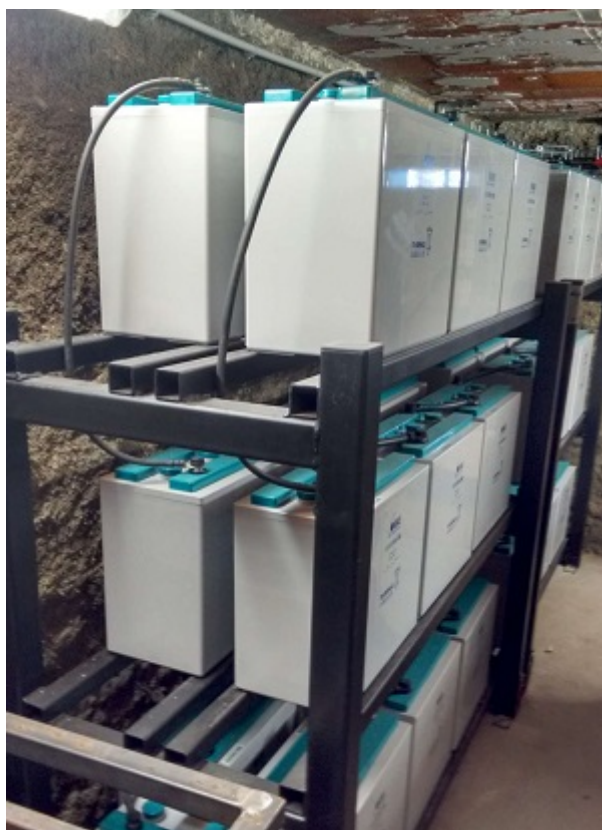
L'unité de stockage d'énergie

Une unité de stockage d'énergie par batterie lithium et plomb et une alimentation de l'éclairage et des matériels informatiques par bus continu complètent le dispositif.