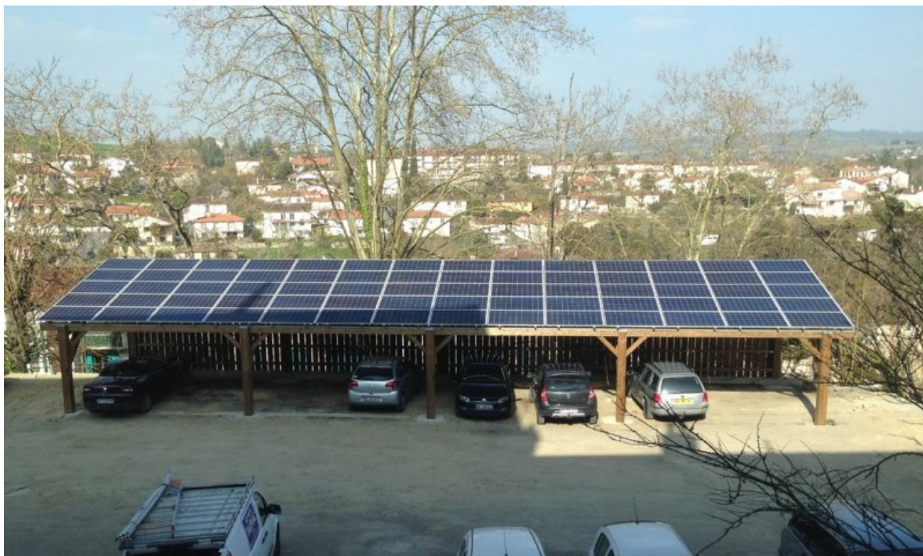
Les panneaux PV installés à l'arrière du bâtiment