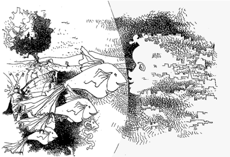
Dessin Yves Perret Architecte